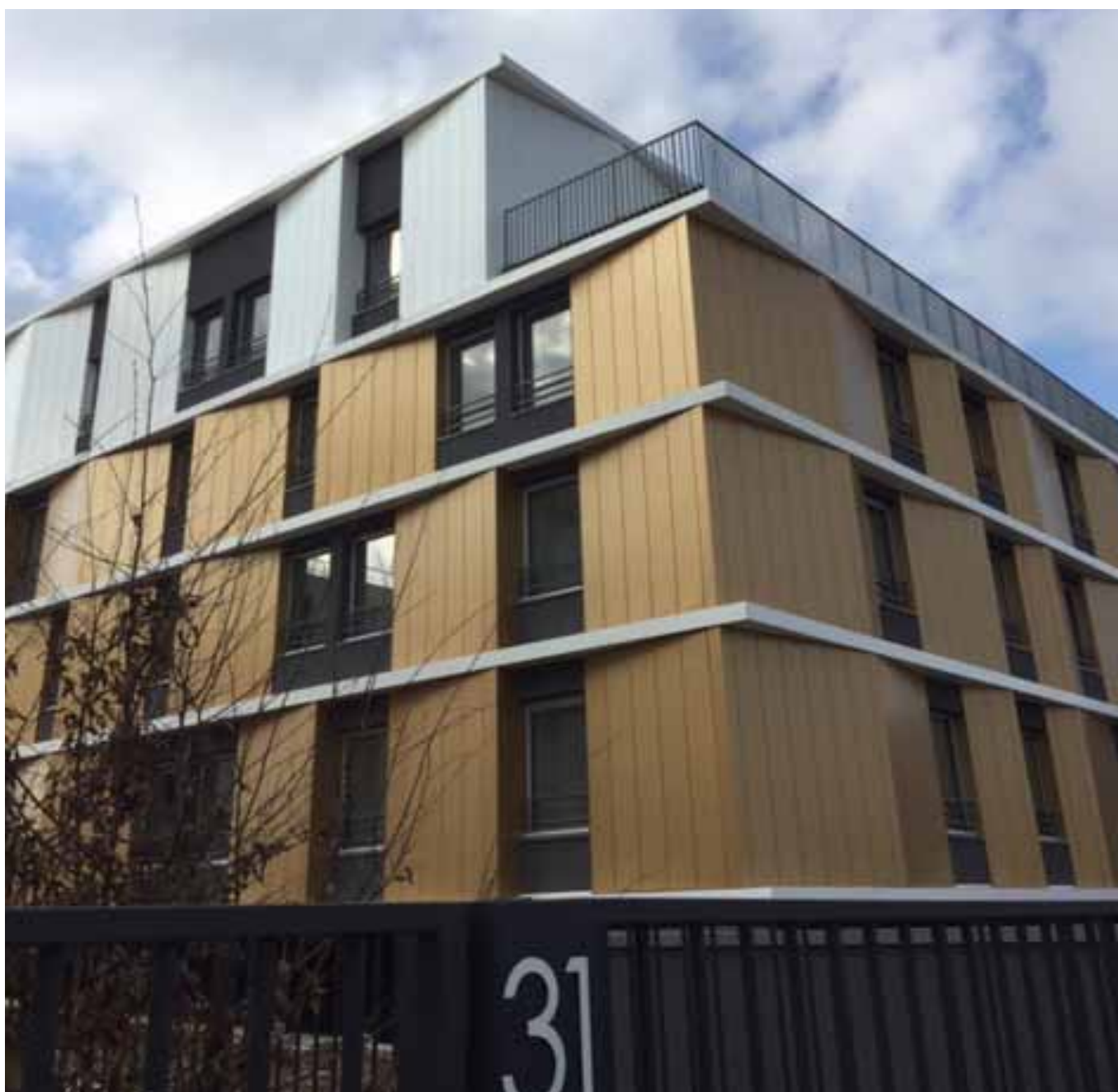
Rue de la Renaissance - Antony (92) Allianz DomiDurable 4

E/S : Ce sigle désigne les critères Environnementaux, Sociaux qui sont utilisés pour analyser et évaluer la prise en compte du développement durable et des enjeux de long terme dans la stratégie d'investissement.