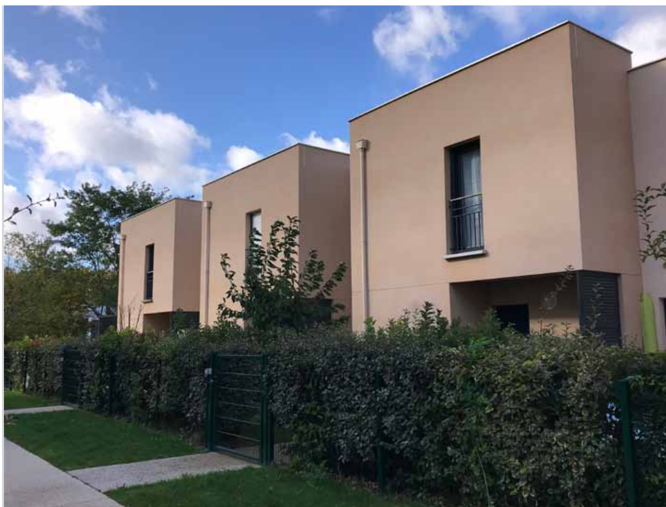
2, rue Willy Brandt – Emerainville (77) Allianz DomiDurable 2

E/S : Ce sigle désigne les critères Environnementaux, Sociaux qui sont utilisés pour analyser et évaluer la prise en compte du développement durable et des enjeux de long terme dans la stratégie d'investissement.