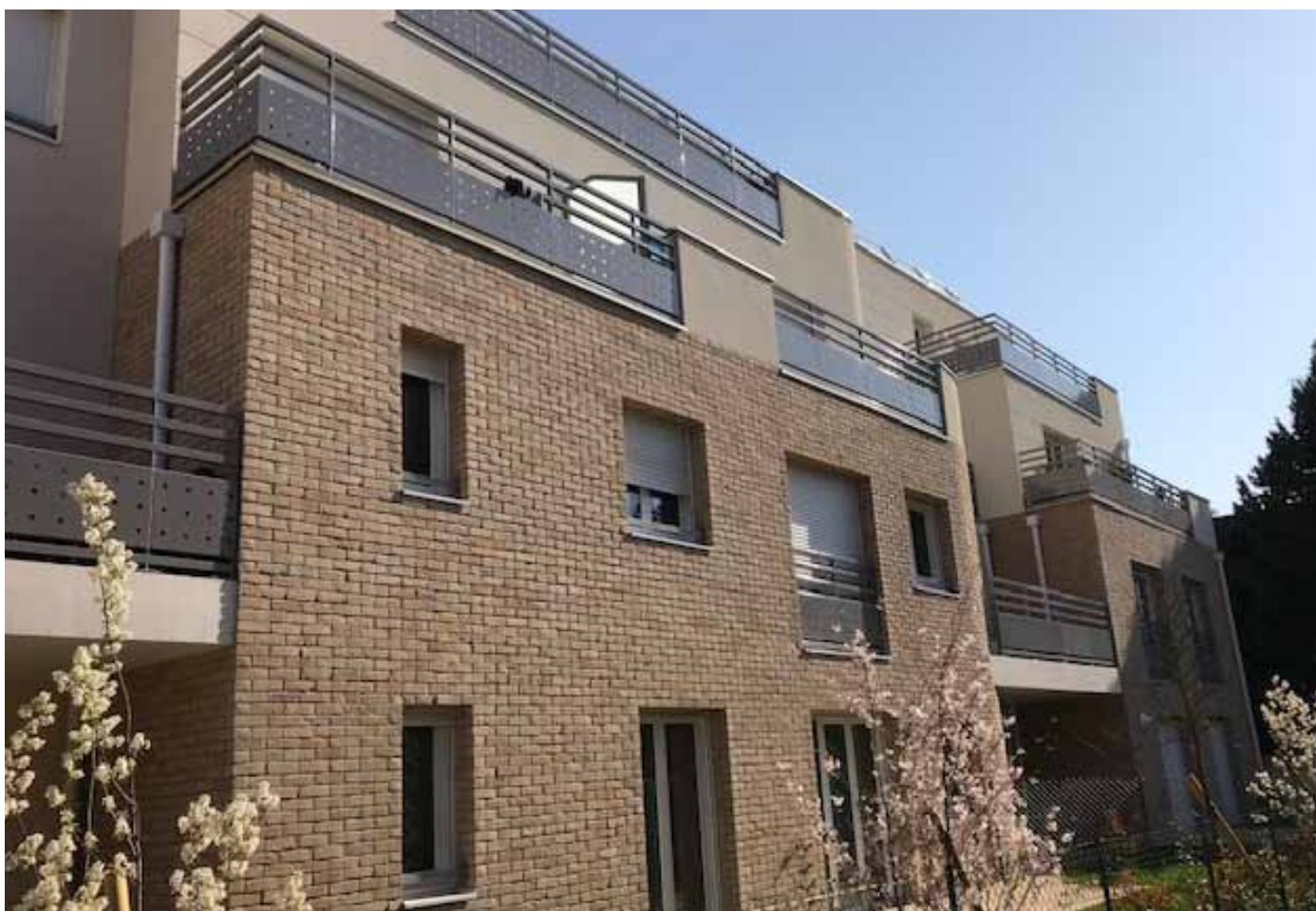
76, avenue du Maréchal Foch – Neuilly Plaisance (93) Allianz DomiDurable 2