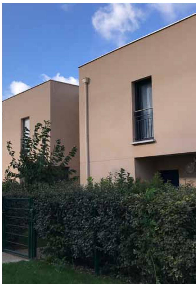
2, rue Willy Brandt – Emerainville (77) Allianz DomiDurable 2

Surtout, au moment où ce rapport est finalisé, il apparaît que la plupart de ces considérations sont bouleversées par la conjoncture mondiale : en effet les événements récents liés à la crise sanitaire générée par l'épidémie de Covid-19 ont déjà impacté l'économie française sur le début de l'exercice 2020 et auront des effets significatifs encore imprévisibles sur le secteur des fonds immobiliers, comme sur tous les secteurs économiques.