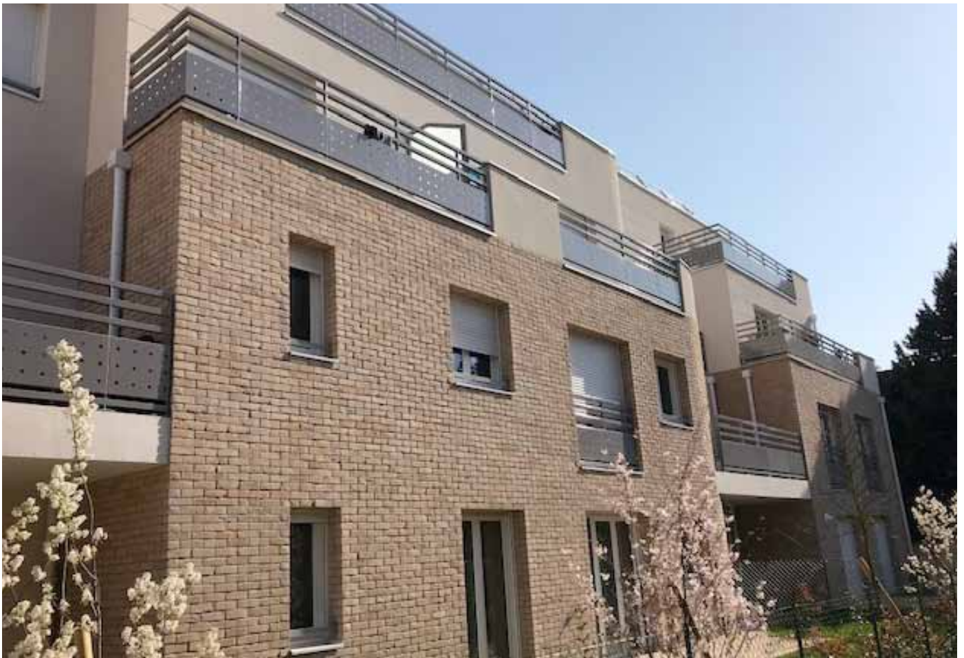
76, avenue du Maréchal Foch – Neuilly Plaisance (93) Allianz DomiDurable 2