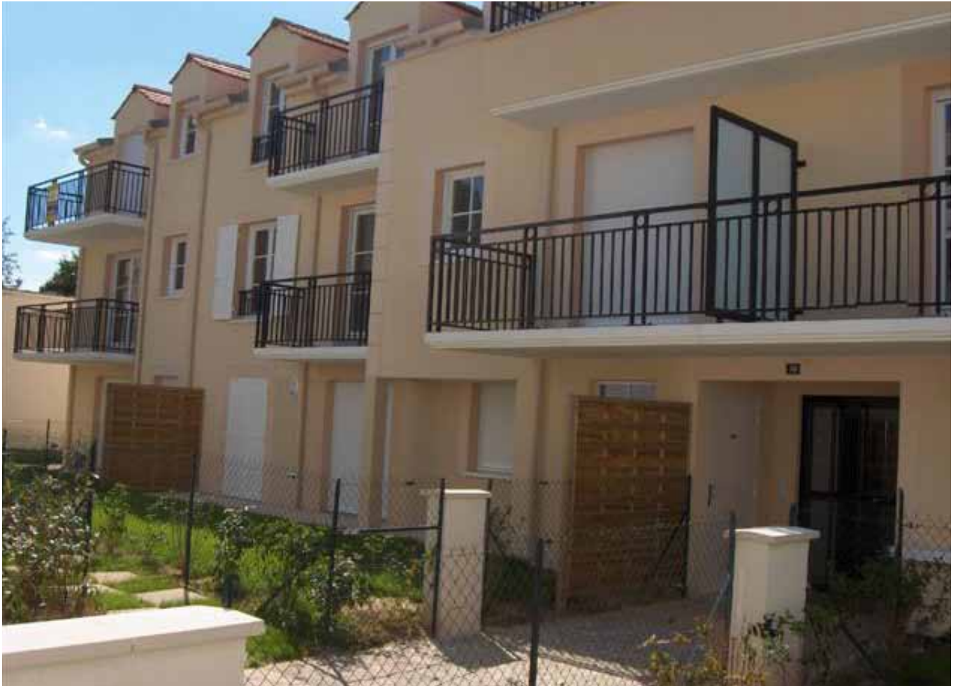
26/28, rue Sainte-Geneviève - Rungis (94) Domivator 2