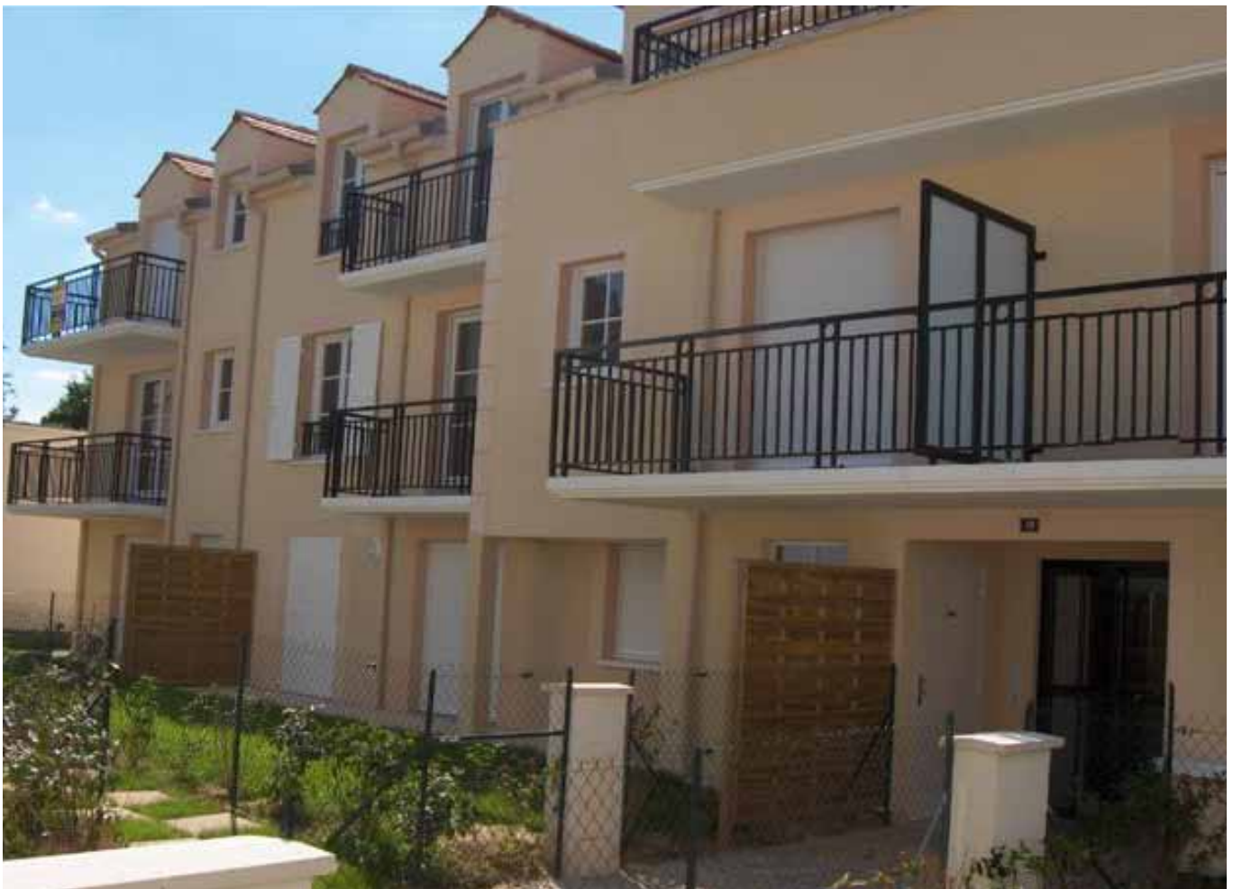
14, rue Robespierre - 83000 Toulon Domivalor