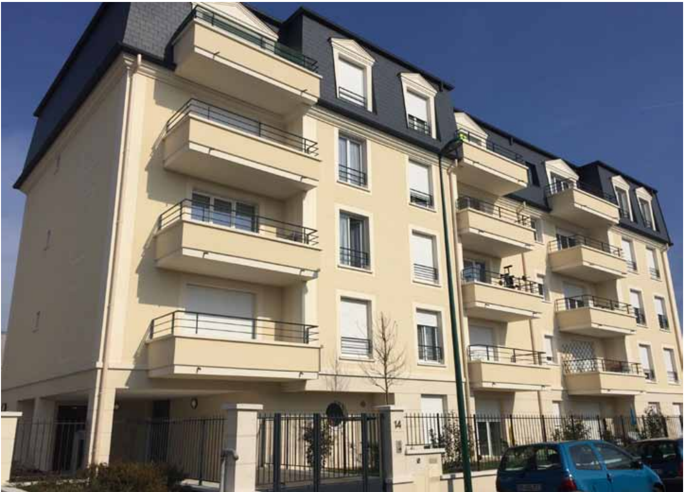
14/16, rue Jules Ferry - Vaires-sur-Marne Allianz DomiDurable