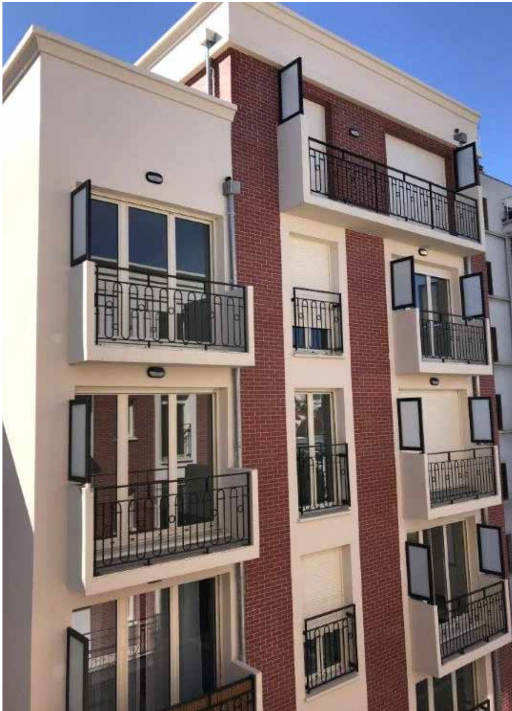
149 -149 bis, rue Jean Jaurès - Maisons Alfort Allianz DomiDurable 3

E/S : Ce sigle désigne les critères Environnementaux, Sociaux qui sont utilisés pour analyser et évaluer la prise en compte du développement durable et des enjeux de long terme dans la stratégie d'investissement.