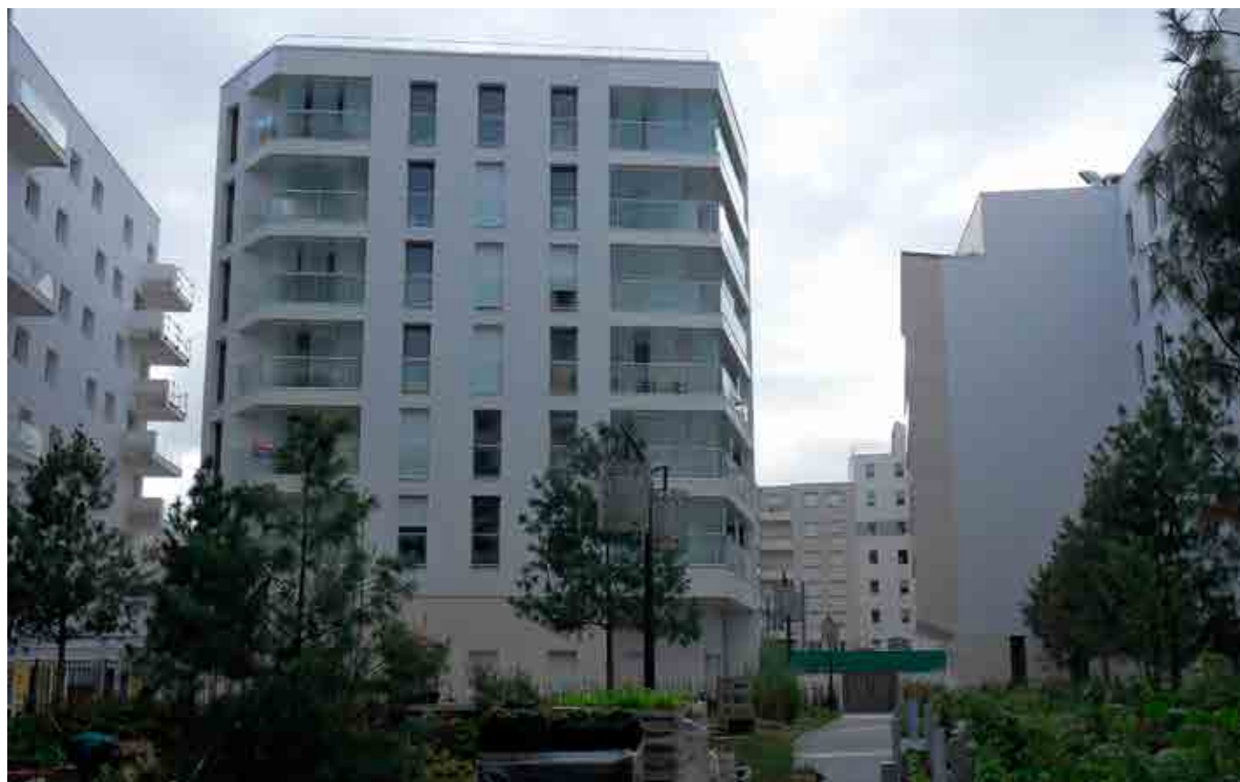
Bords de Seine - Issy Les Moulineaux

La SCPI a poursuivi la commercialisation des immeubles livrés : 3 nouveaux immeubles, Montpellier, Marseille et Issy les Moulineaux (ZAC des Bords de Seine), ont été réceptionnés au cours du trimestre et 65 appartements livrés. Sur les 875 appartements déjà réceptionnés, 807 logements sont désormais loués et 68 appartements sont en attente d'une première mise en location. Les délais de première location se rallongent en raison d'une offre importante de logements neufs et malgré les efforts commerciaux déployés. Au cours du trimestre, 25 appartements ont fait l'objet d'une relocation et 24 appartements ayant fait l'objet d'une première location sont de nouveau vacants, Bayonne étant la ville la plus touchée.