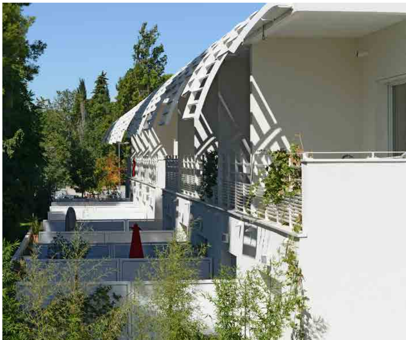
Green Village - Montpellier (34)

La conclusion de ce 1 er trimestre 2014 est que la demande est déprimée face à une offre de plus en plus limitée. Dans les zones les plus tendues, les ménages français en quête de mobilité n'ont plus le choix entre un secteur locatif social à la file d'attente infinie, un secteur de l'immobilier neuf qui peine à construire des logements à des prix raisonnables et un secteur de l'accession dont les primo-accédants sont exclus.