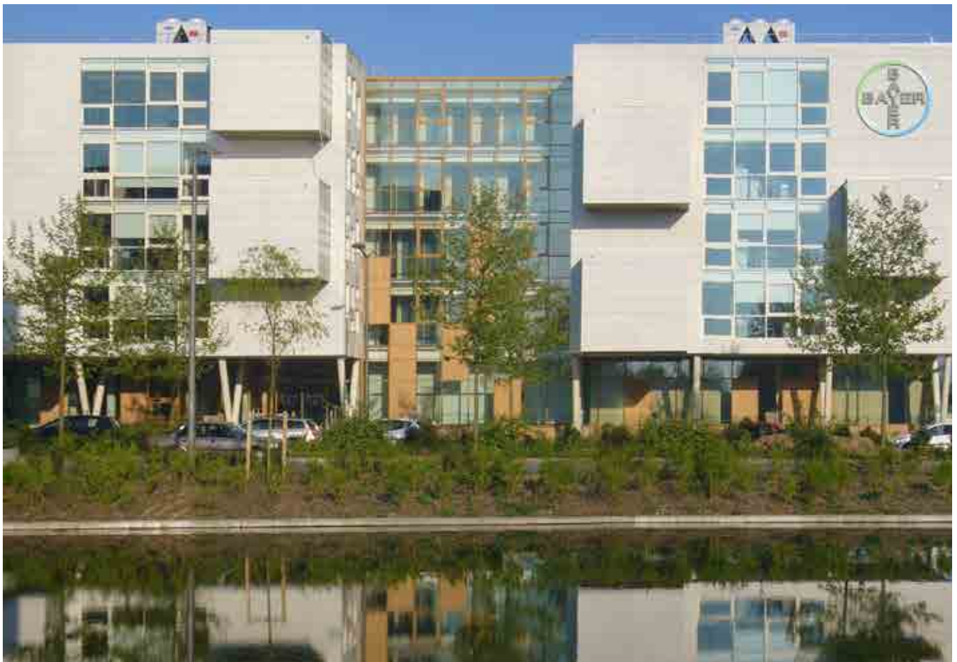
Immeuble - Loos-Lez-Lille

Quelques signaux encourageants viennent ponctuer ce tableau : les investisseurs s'intéressent de plus en plus aux actifs moins sécurisés, anticipant peut-être ainsi une amélioration de la situation.